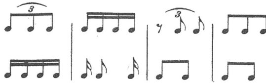
2. faksimile. Molnár Antal: A zenei ritmus alapfogalmai (Elemi ritmika) , 17–18.

Mondják, o hogy | mindegyikünk | bir egy | csillaggal, o | S az, akié | lehull az | égről, o | meghal. | (Petőfi)