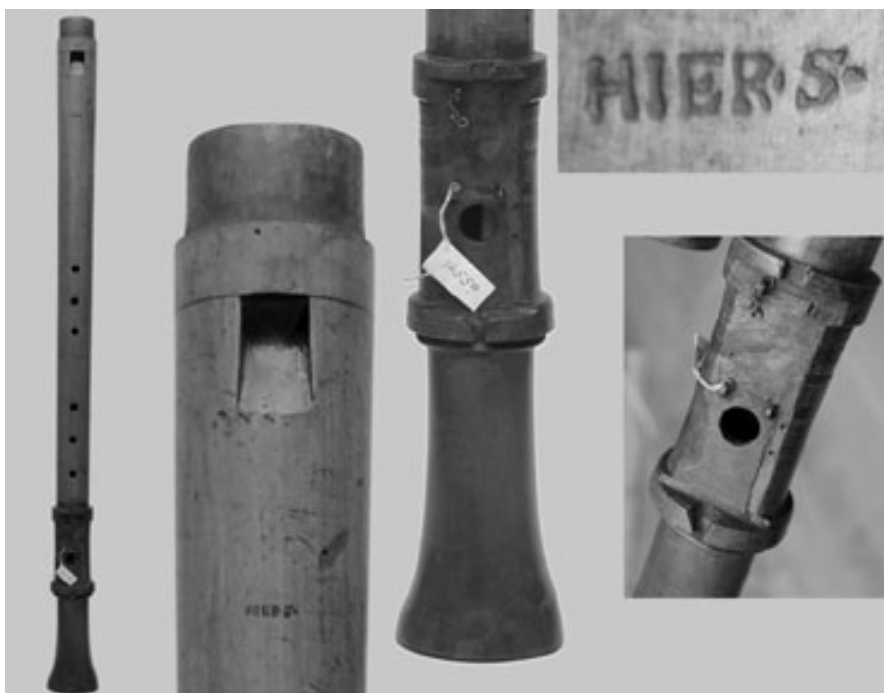
2. kép. A HIER•S• basszsfurulya