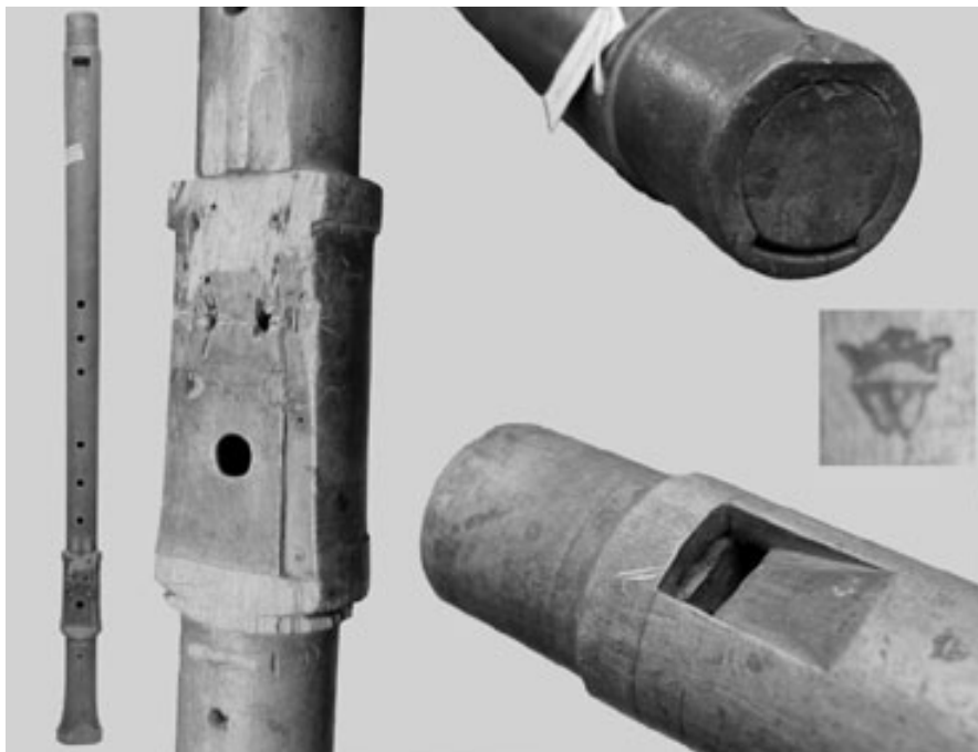
1. kép. A W-korona basszsfurulya