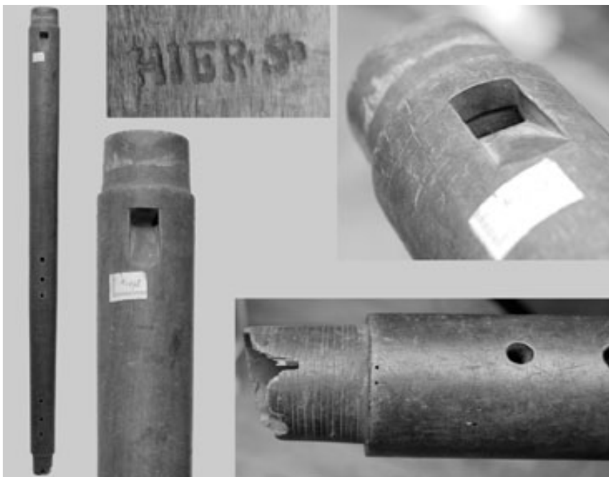
4. kép. A HIER•S• nagybasszus-furulya